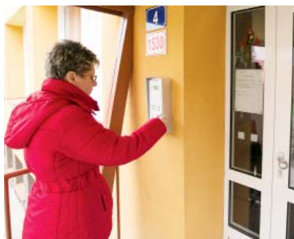
Školky hlídají kamery.

„Je důležité, aby rodiče měli jistotu, že jejich dítě je ve školce v bezpečí a do budovy se nedostane nikdo, kdo tam nemá co dělat. Vzhledem k tomu, že školky mívají vět-