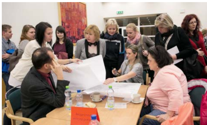
Lidé, kteří přišli diskutovat o prioritách Poruby, zcela zaplnili sál Domova Slunečnice Ostrava.

„Jsme rádi, že lidé měli o setkání zájem a v tak velkém počtu se ho zúčastnili. Chtěl bych jim poděkovat, že svůj čas věnovali problémům obce a konstruktivně se snažili popsat, co je trápí. Těší mě, že přišli i studenti, kteří pracovali u stolu mladých. Je pěkné, že i mladým lidem není budoucnost Poruby