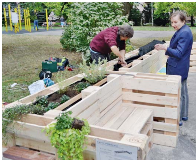
Díky iniciativě občanů vzniklo na pátém obvodu paletové posezení.

Lidé, které projekt zaujal, mohou přijít 5. dubna v 17:00