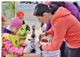
Sezónu akcí na Hlavní třídě zahájí Den Země.