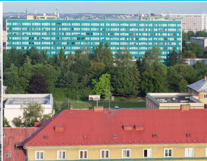
Pohled k rektorátu VŠB-TUO z věžového domu na Havlíčkově náměstí koncem 70. let 20. století a v roce 2014.