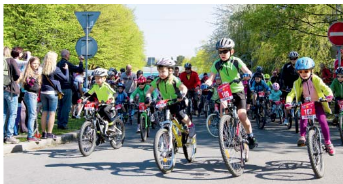
Porubajk MTB maraton si užijí i děti.

„Pro děti jsme připravili desetikilometrový závod, ti nejmenší mohou společně s rodiči vyrazit na trať dlouhou tři kilometry. Starší děti a dospělí si mohou zvolit, zda pojedou hlavní okruh, který měří osmašedesát kilometrů, či zda zvolí trasu o třicet kilometrů kratší. Obě vedou okolím Poruby. Ti, kteří startují pravidelně, znají trať velmi dobře a není třeba ji nějak podrobněji popisovat. Nováčci mapu závodů najdou na