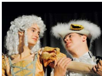
Na Jarní slavnosti se představí žáci školy.

Výročí si žáci, rodiče i učitelé připomenou 7. dubna od 16:00 hodin na Jarní slavnosti. „Děti i pedagogové školy se představí v divadelních a hudebních vystoupeních v sále Střední školy prof. Zdeňka Matějčka na ulici 17. listopa-