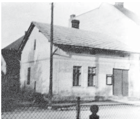
Domek, ve kterém přespal generál Jeremenko.

V té době byl přesvědčen, že v jeho domě přenocovali mladí důstojníci. Ráno se ale dočkal překvapení. „Když jsem se šel podívat ráno domů, u dveří stála stráž s automatem. Podle oslove-