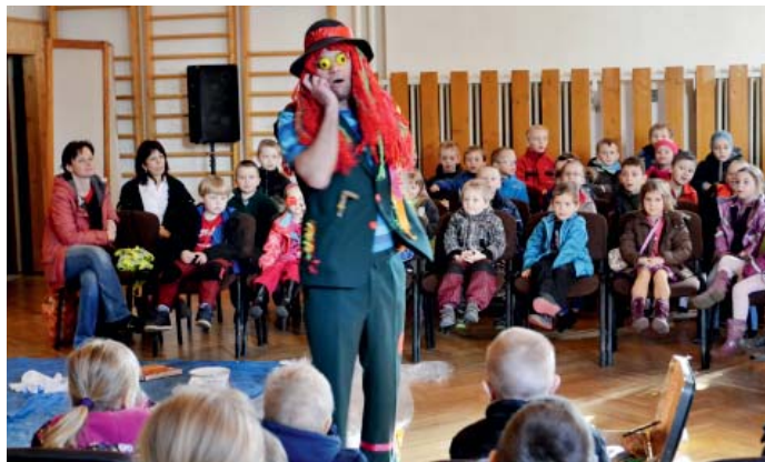
Přehlídka divadelních souborů se v Porubě koná už po čtrnácté.