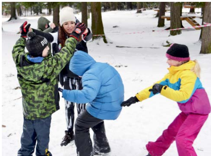
Žáci ze Základní školy na ulici Ivana Sekaniny si užívali sněhu.

Ozdravné pobyty se konají druhým rokem. Loni na ně vyjelo přibližně 1200 žáků 2. až 5. tříd, letos jich bude ještě o pět set více. Dvanáctidenní pobyty se konají v rekreačních střediscích Tři Studně Penzion Sykovec, kde je pro