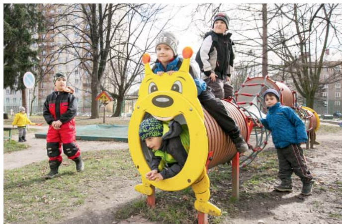
Veřejnosti se letos otevře pět zahrad mateřských škol.

V průběhu dubna tak budou veřejnosti otevřeny zahrady mateřských škol na ulicích Dvorní, Skautská, Ukrajinská, Josefa Skupy a Otakara Jeremiáše. „Dříve