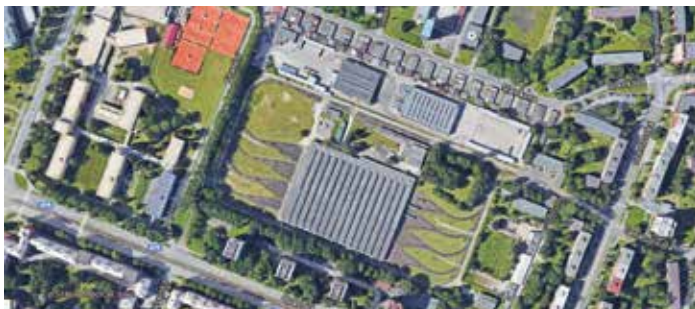
Pohled na území vozovny

Co v území vozovny konkrétně bude, je otázkou dalšího dlouhodobého plánování. „V první řadě nechceme připustit, aby se z území stal brownfield, průmyslová zóna nebo aby tam vyrostl další super- nebo hypermarket,“ řekla