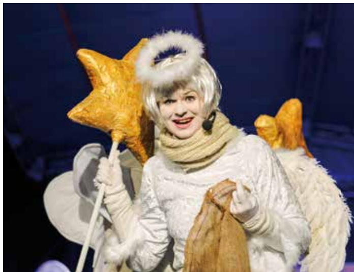
Nebeští andělé z Cirkusu trochu jinak budou chodit i na chůdách.