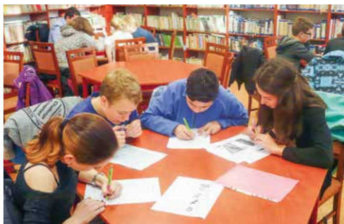
Družstvo Wigym I při soutěži

„Těší mě, že se děti zajímají o obec, v níž žijí, a jsem rád, že tady máme pedagogy, kteří jejich zájem o historii