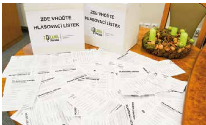
Pro jednotlivé nápady hlasovalo na čtrnáct set Porubanů.

Za pítkem následovala výstavba chodníku v ulici Josefa