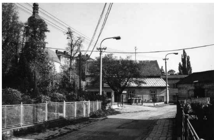
Ulice V Zahradách koncem sedmdesátých let 20. století a nyní.