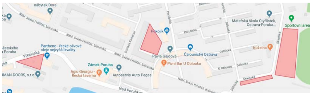
Červeně jsou v mapě vyznačena místa náhradního parkování.

Po dobu prací bude ulice nábřeží SPB zjednosměrněna. Průjezdny bude pruh ve směru od Svinova. Ve směru od ulice 17. listopadu bude provoz u kostela uhybat po Klimkovické – která také bude dočasně jednosměrná – na Vřesinskou.