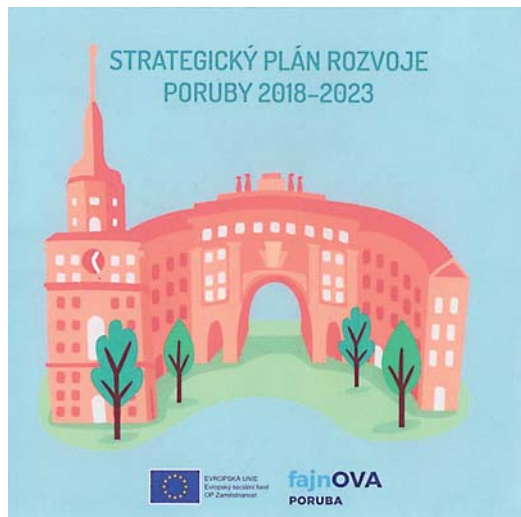
Titulní stránka strategického plánu rozvoje Poruby, z něhož akční plán vychází.