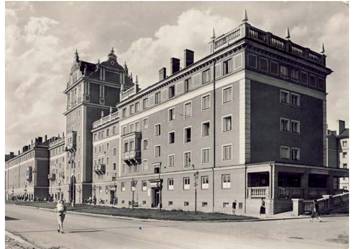
Věžičky po úplném dokončení Foto a nákres: archiv Mariana Liptáka

Věžička s průchodem zaujme svým neobvyklým řešením dispozic nadzemní i podzemní části, za které vděčí právě průchodu. V suterénu se většina sklepních boxů nachází přímo pod průjezdem a sklep je díky tomu umístěn hlouběji, než je zvykem (nosná konstrukce domu nese i váhu vozovky v průjezdu). V nadzemní části díky průjezdu vysokému jako dvě podlaží vznikly po stranách úzké prostory. Na jedné straně tak je pouze schodiště a chodba doplněná o společenskou místnost, na druhé