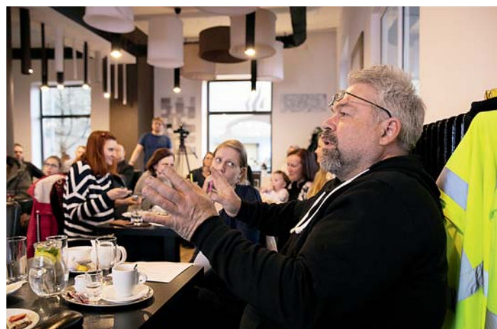
Na kávu se Zelenou Porubě mohli 26. března do Kafe Palača přijít všichni, které zajímá, jaké budou letos podmínky přihlašování návrhů.

Pro rok 2019 se pravidla projektu dočkala významné změny: nově se bude hlasovat ve dvou kategoriích. „V jedné kategorii budou návrhy, jejichž