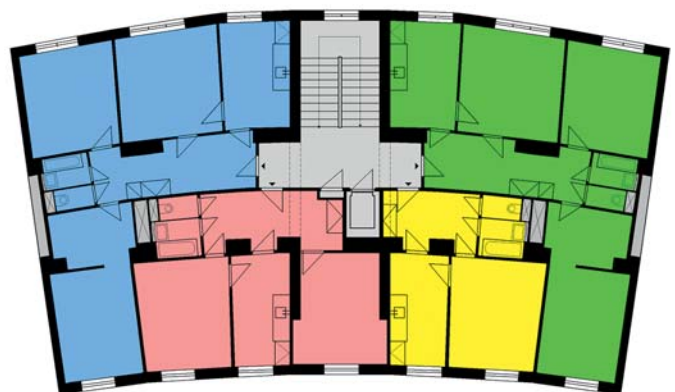
Půdorys typického podlaží v Oblouku