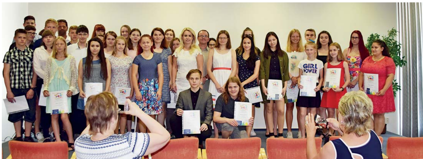
Ocenění žáci z porubských základních a středních škol