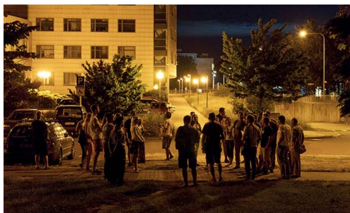
Jak vypadá město v noci? První osvětová vycházka pátým obvodem se konala v červnu.