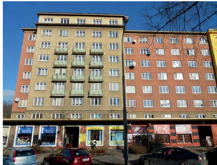
Bytové domy T17 na Hlavní třídě

Typová řada T nás provází již od nultého obvodu a je tak v Porubě velmi obsáhlá. Po nejstarších typech T12 v nultém obvodu přes novější T16 v prvním a druhém obvodu jsme se právě dostali k typu T17, který je vývojově posledním stupněm řady T. Třetí obvod tak byl poslední, kde se řada T uplatnila. Z hlediska konstrukční stránky se bytové domy T17 od svých starších předchůdců příliš neliší – stále se stavěly z předem připravených cihlových kvádrů a svou celkovou konstrukcí a pracností při výstavbě měly stále