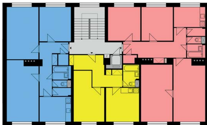
Půdorys typického podlaží

Existovalo mnoho variant dispozic, navíc bylo kvůli Hlavní třídě postaveno i mnoho atypických domů s nápaditou architekturou a velkými byty. Tyto atypické domy samozřejmě vycházejí z dnes popisovaného typu T17. Jako ukázkou dispozic bytů jsme však zvolili běžné dispoziční provedení typu T17, které se vyskytuje zejména v běžných vnitroblocích. Krajní byty jsou velice rozměrné a obsahují i dvě komory, prostřední byt existuje v několika provedeních a v některých domech k němu patří i přilehlá místnost sousedního červeného bytu. Domy byly vybaveny i velice malým osobním výtahem.