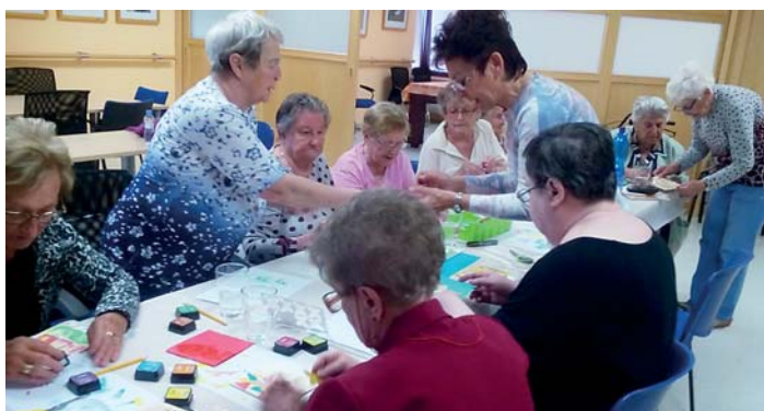
DÍLNA A VZPOMÍNKY | V kreativní dílně se pravidelně mění klubovny v domě s pečovatelskou službou (DPS) na Průběžné ulici a v DPS Astra na ulici I. Sekaniny. S obyvateli těchto zařízení vyrábějí během výtvarných odpolední nejrůznější okrasné věcíčky členky spolku Kreativ při organizaci Seniori ČR. Seniorům z DPS Průběžná bylo určeno také vzpomínkové odpoledne (foto vpravo). Na něm se mohli seznámit s projektem Paměť Ostravy, který organizuje Knihovna města Ostravy (KMO) a díky němuž se příštím generacím zachovávají vzpomínky dříve narozených Ostravanů. Z nich byl před časem sestaven a vydán almanach Paměť Ostravy 2014–2016. Lidé, kteří by se chtěli podílit i o své vzpomínky, se mohou obrátit na knihovnice v kterékoliv pobočce KMO. (jan)