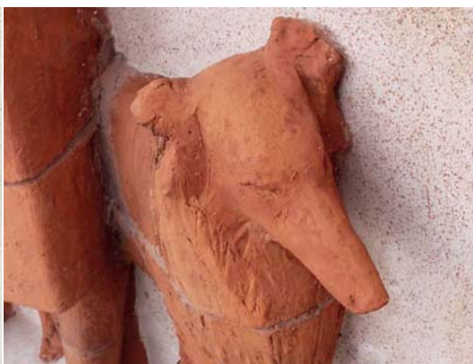
Stav před zásahem a po něm

vebních (a statických) oprav a s nimi souvisejících klempířských prací.