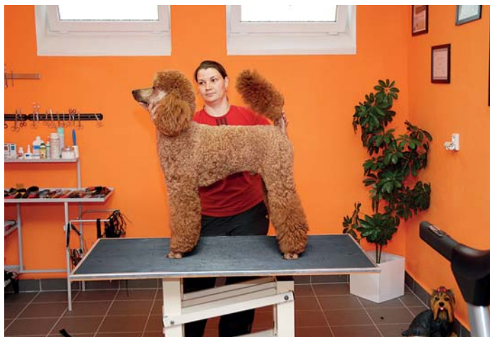
Velký pudl je po všech procedurách opravdu fešák.

Je zřejmé, že si rázná žena u psů umí zjednat respekt. Díky tomu mohou být jejími zákazníky i zástupci obřích plemen: upravuje irské vlkodavy, leonbergry i brazilské fily nebo moškevské strážní psy. „Jsme na to zařízení,“ ukazuje rozměr-