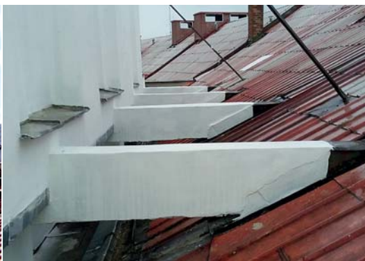
Atiku bylo třeba řešit komplexně, na ní zub času zahlodil pořádně...