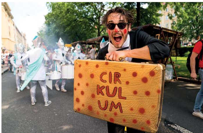
CIRKULUM POČTVRTÉ | Tři dny, pět scén, osmdesát vystoupení a další desítky mimů a živých soch. To byl ve stručnosti čtvrtý a podle ohlasů diváků i nejvydařenější ročník mezinárodního festivalu nového cirkusu a pouličního divadla Cirkulum. Už počtvrté proměnil Hlavní třídu v jednu velkou manéž, kde vystupovali kolombíny, harlekýni, akrobati, žongléři, muzikanti a pouliční umělci všeho druhu. (mot)