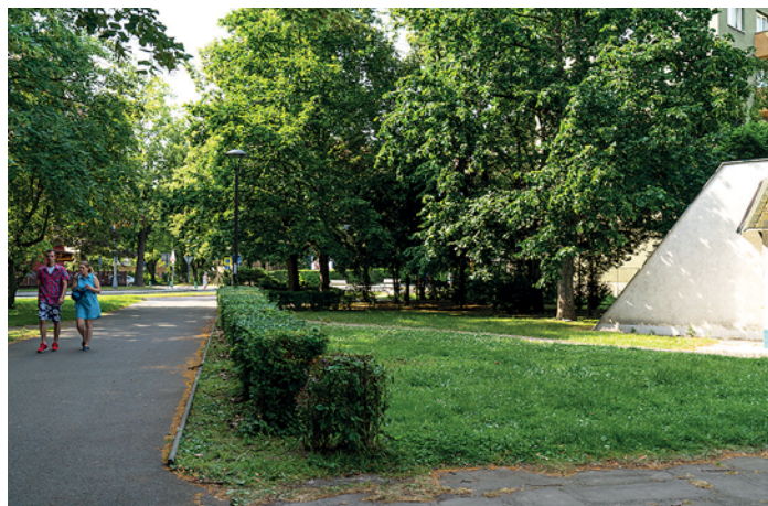
Věřte nevěřte, ale snímky jsou v rozmezí 50 let skutečně pořízeny ze zhruba stejného místa – pohled od Floridy k ZŠ Porubská 832 (kdysi Fučíkova) koncem 60. let minulého století a nyní.