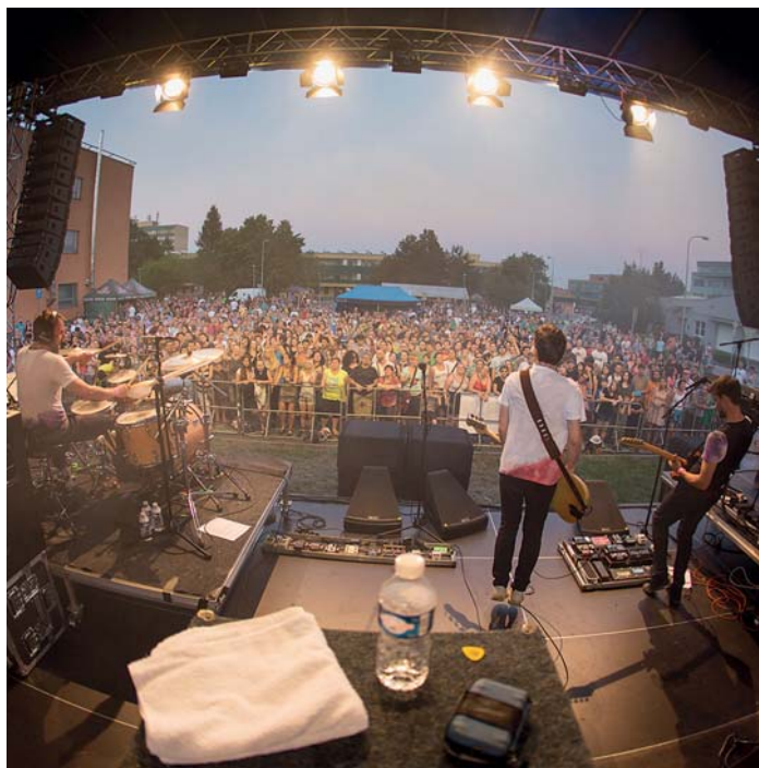
Festivalové koncerty mívají velkou návštěvnost.

Organizátoři vám představí zázraky vědy a techniky využití v profesích, abyste si do-