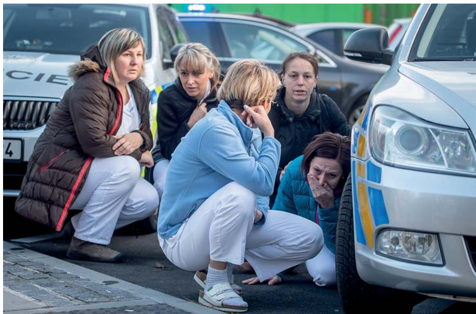
Fotografie, která obletěla svět. Jejím autorem je fotoreportér Deníku Lukáš Kaboň.

Dvačtyřicetiletý muž z Opavska začal nelegálně drženu zbraní v objektu polikliniky v čekárně traumatologické ambulance bez varování střílet v úterý 10. prosince po 7. hodině. Zasáhl devět lidí. Pak střelec odešel a asi o tři hodiny později,