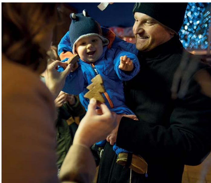
Vánoce se srdcem aneb Punč si dá táta, já chci perníček!