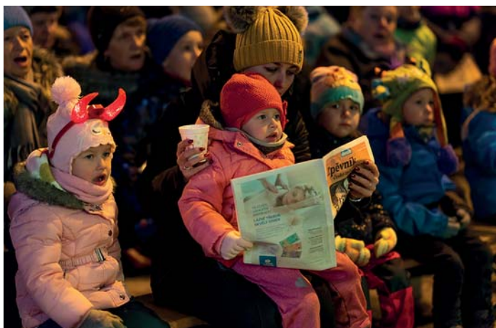
Společné zpívání koled je již tradicí.