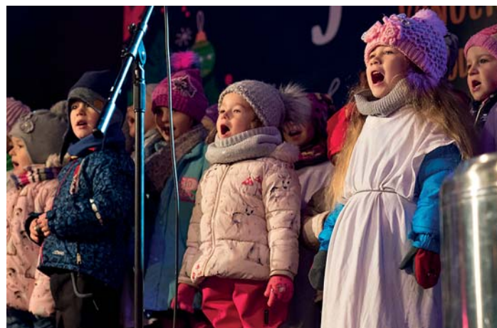
Zpívat je třeba s nadšením.