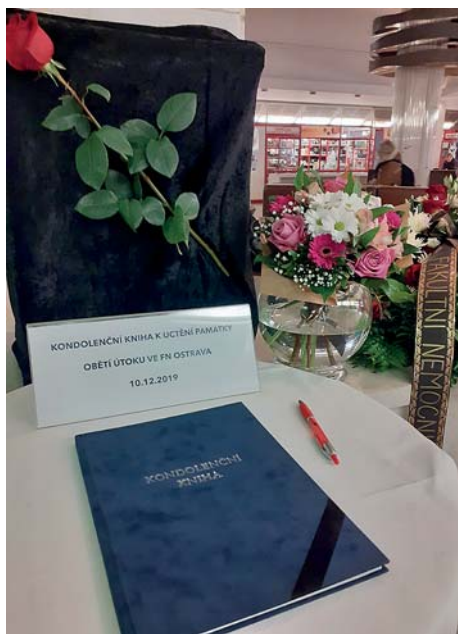
Kondolenční kniha ve vestibulu polikliniky