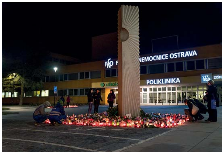
Před poliklinikou vznikla pietní místa, kam lidé chodili s květinami a kde zapalovali svíčky.