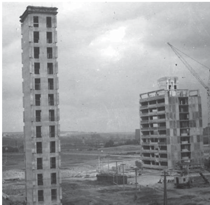
Stavba „švédáků“ byla velice zajímavá.

Věžové domy V-OS dostaly díky době svého vzniku do vínku opravdu povedenou architekturu. Jejich hranolovitý tvar vyvážených proporcí byl v průčelích rozdělen formou pásů oken a pásů betonu (břízolitu). Mezi okny byly namísto vy-