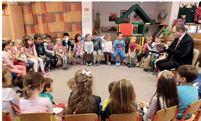
Děti ze tříd Brouček a Beránek byly vděčnými posluchači.