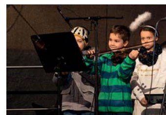
Vystupovaly děti z porubských škol a školek.