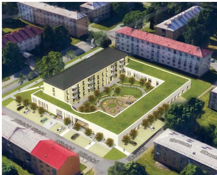
Vizualizace komunitního domu pro seniory na Dělnické ulici z Ateliéru 38

„Další velkou investicí je příprava projektové dokumentace rekonstrukce domu na ulici U Oblouku, která vyjde na šest milionů korun. Chystá se také výstavba víceúčelového veřejně přístupného hřiště u Základní školy Josefa Valčíka nebo rekonstrukce elektroinstalace ve školce na ulici Josefa Skupy, která budou stát každá pět milionů korun, zhruba stejnou částku vydáme na přípravu projektových