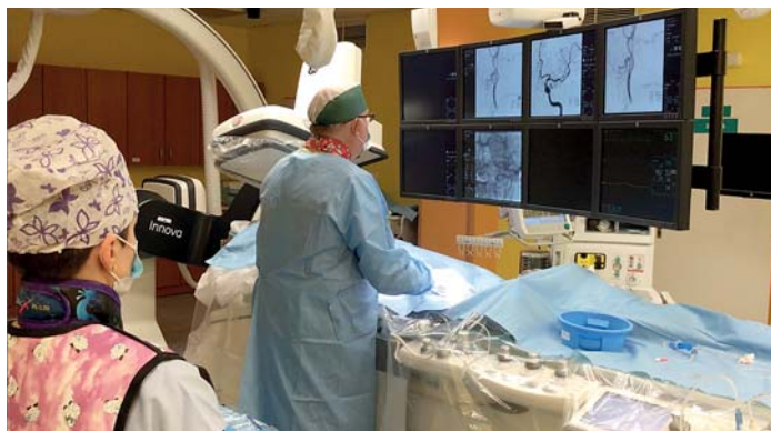
Tisící lékařský zákrok u pacienta s akutní ischemickou cévní mozkovou příhodou – tzv. mrtvicí

Tisící lékařský zákrok u pacienta s akutní ischemickou cévní mozkovou příhodou provedli 7. prosince na oddělení intervenční neuroradiologie a angiologie Radiodiagnostického ústavu Fakultní nemocnice Ostrava. Tzv. mrtvice je v České republice jednou z nejčastějších příčin úmrtí. Výskyt mrtvice je 241 případů na 100 tisíc obyvatel.