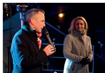
Vánoce CZ-PL: starostové Poruby a Ratiboře