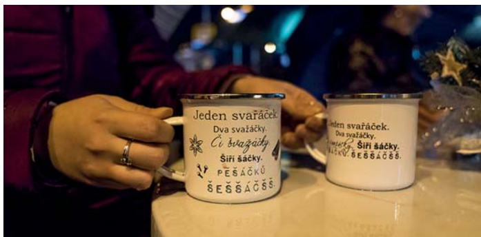
Patnáct dní příležitostí dát si s přáteli svařák – nejlépe do stylového plecháčku.

Porubský vánoční jarmark se konal od 8. do 22. prosince. Tradičně byl zahájen rozsvícením vánočního stromu (letos to byla dvanáctimetrová douglaska). Nabídl řadu vystoupení dětí z porubských mateřských i základních škol, kapel, hudebních těles a pěveckých seskupení z daleka i z blízka, společné zpívání koled, česko-polská setkání nebo charitativní punč s vedením obvodu. A samozřejmě spoustu příležitostí dát si na Alšově náměstí svařáček s přáteli...