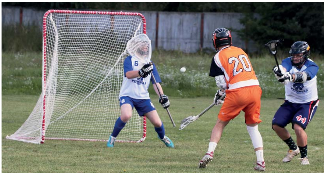
Ostrava Pitbulls existují jen něco přes rok, přesto už dokázali uspořádat mezinárodní turnaj.

Lidé, kteří mají rádi netradiční sporty, mají šanci vyzkoušet si jeden nový. V Porubě vznikl první lakrosový tým v Moravskoslezském kraji. A hledá nové členy.