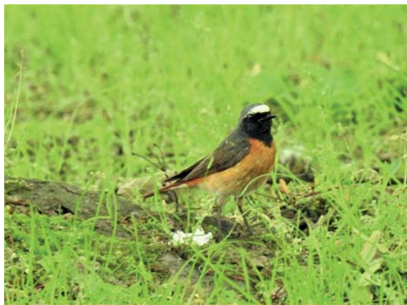
Rehek zahradní – sameček...

Rehek zahradní patří mezi tažné druhy. Do hnízdiště se vrací kolem poloviny dubna. Ve výběru vhodného stanoviště k hnízdění je poměrně nevybíravý: zahrnuje v dutině stromu, v budce, na trámu