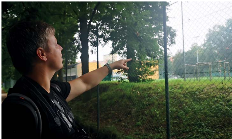
Na hřišti ZŠ J. Šoupala snídaly straky.

♦ Typické hlasy ptáků si můžete poslechnout například díky aplikaci pro mobilní telefony Hlasy ptáků, na webu nasiptaci.info, www.ornita.cz nebo www.birdlife.cz .