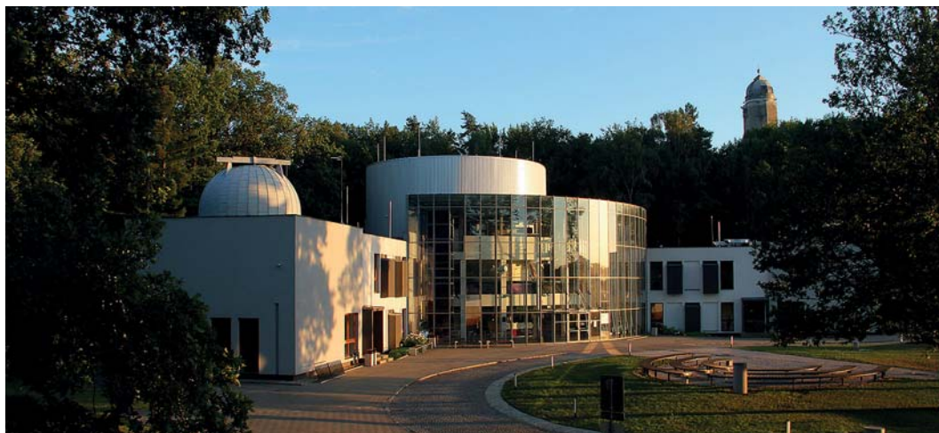
Planetárium Ostrava najdete u porubského lesoparku.