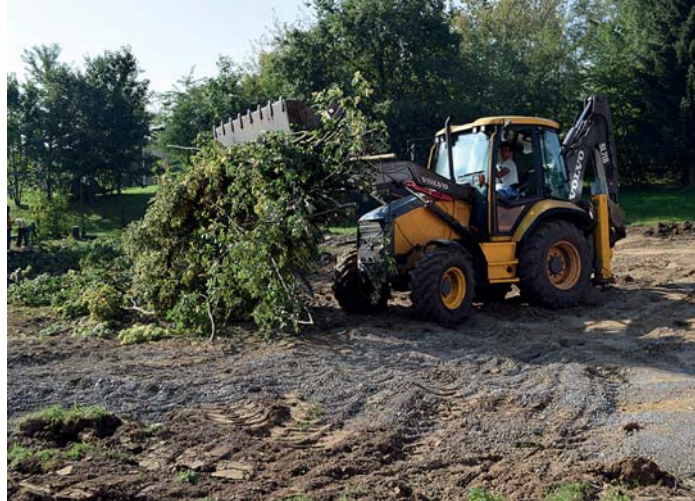
Začátek výstavby hřiště u ZŠ J. Valčíka

„Moderní víceúčelové hřiště poskytne kvalitní zázemí pro školu a odpoledne bude přístupné veřejnosti. V docházkové vzdálenosti podobné místo chybí, takže věříme, že ho budou využívat všechny generace. Uvažujeme i o tom, jak by bylo možné hřiště vyu-