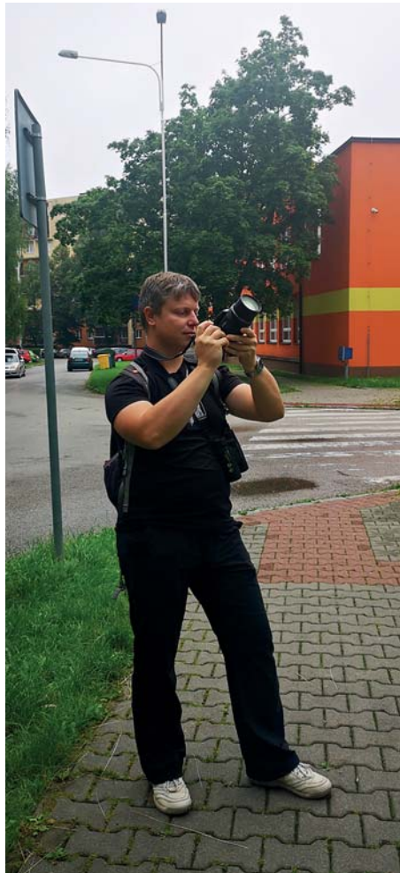
Pozorování nezvyklého ptačího společenstva

A jaký je názor ornitologa na rozmístování ptačích budek? Například u mapovaného lejska se to podle něj hodně projevilo –