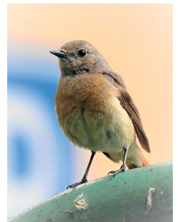
... a samička.

střech nebo zahradního altánu – ale také v dutině v zateplení domu.