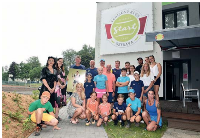
Nové tenisové kurty přijel slavnostně otevřít svého času pátý hráč žebříčku ATP Jiří Novák (stojící s fotografií).

♦ TJ Start Ostrava vychovává spoustu talentovaných hráčů a hráček. Jednou z nich je Bára Pokorná, která díky svým výkonům zaujala i v USA, kam na podzim odjíždí. „Získala jsem sportovní stipendium na univerzitě v lowě. Vedle tenisu tam chci studovat a věřím, že si od tamtudo odnesu spoustu zkušeností,“ říká dvacetiletá hráčka, která za svůj největší vzor považuje Rafeala Nadala.