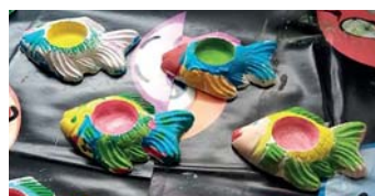
Každé dítě si sádrový odlitek omaluje jinak.

Její nabídka kreativního tvoření s povídáním je zajímavá především pro školy a školky, takže největší zájem byl právě ze strany pedagogů, organizátorů dětských táborů nebo rodičů, kteří chtějí zabavit děti.