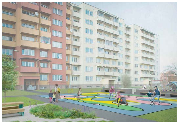
Návrh Duhového hřiště Vizualizace: Laura Doležalová a Markéta Káňová

„Děkuji všem aktivním sousedům za spolupráci a všem, kteří pro náš návrh hlasovali,“ uved-