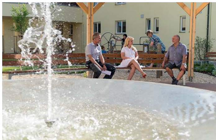
Klidné posezení v atriu DPS Harmonie

Atrium nabízí odpočinkovou zónu s množstvím zeleně, lavičkami, hřištěm pro děti či posilovacími stroji pro seniory. Dominantou je podsvícená fontána. Součástí jsou i garáže, které jsou určeny obyvatelům domu a městské policii, která