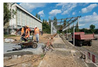
Výstavba hřiště pro americký fotbal (u ulice L. Štůra)

Celková modernizace areálu dále zahrnuje například nový atletický ovál, workoutové hřiště nebo občerstvení se zahrádkou a dětským hřištěm. (mmo)