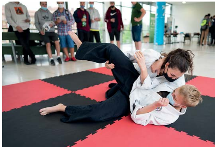
Každá škola se snažila zaujmout – například fyzickou zdatností svých studentů.

Na přehlídce se vedle sebe budou prezentovat školy stát-