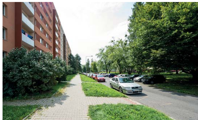
Ulice se do roku 1980 jmenovala Jaroslava Heyrovského, nyní už jen Heyrovského.

K porovnání slouží rejstřík – Seznam ulic a veřejných prostranství města Ostravy. Při navrhování názvů ulic se nesmí používat podobné znějící názvy nebo názvy s velmi podobnou grafickou podobou jména (např. Hlavní a Hlavní třída). Názvy ulic se musí uvádět vždy v českém jazyce a nesmí se pojmenovávat podle žijících osob. Název ulice nesmí urážet národní, národnostní nebo náboženské city občanů, nesmí