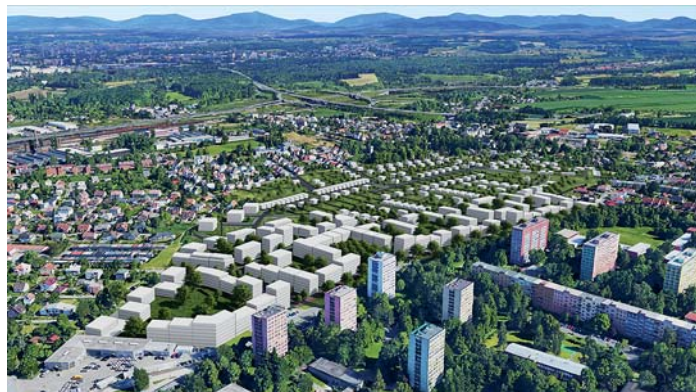
Vizualizace: MAPPA Ostrava

„Studie se dívá na území komplexně a usiluje o provázání s okolními částmi města. Zabývá se například tím, jak by měly vypadat budoucí ulice, jaká bude výška nové zástavby, kde mají být veřejná prostranství nebo kde bude vhodné mít obchody a služby.