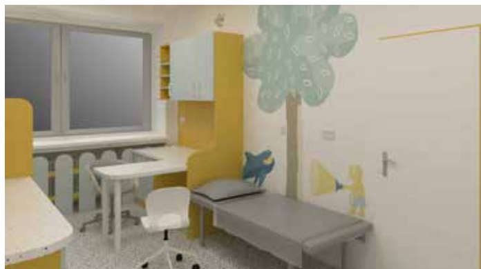
Pro lékaře pro děti a dorost připravili v poliklinice novou ambulanci. Vizualizace: Ondřej Turoň

Lékařskou pohotovostní službu pro dospělé zajišťuje Městská nemocnice Ostrava na Varenské ulici ve všední dny od 17 do 22 hodin,