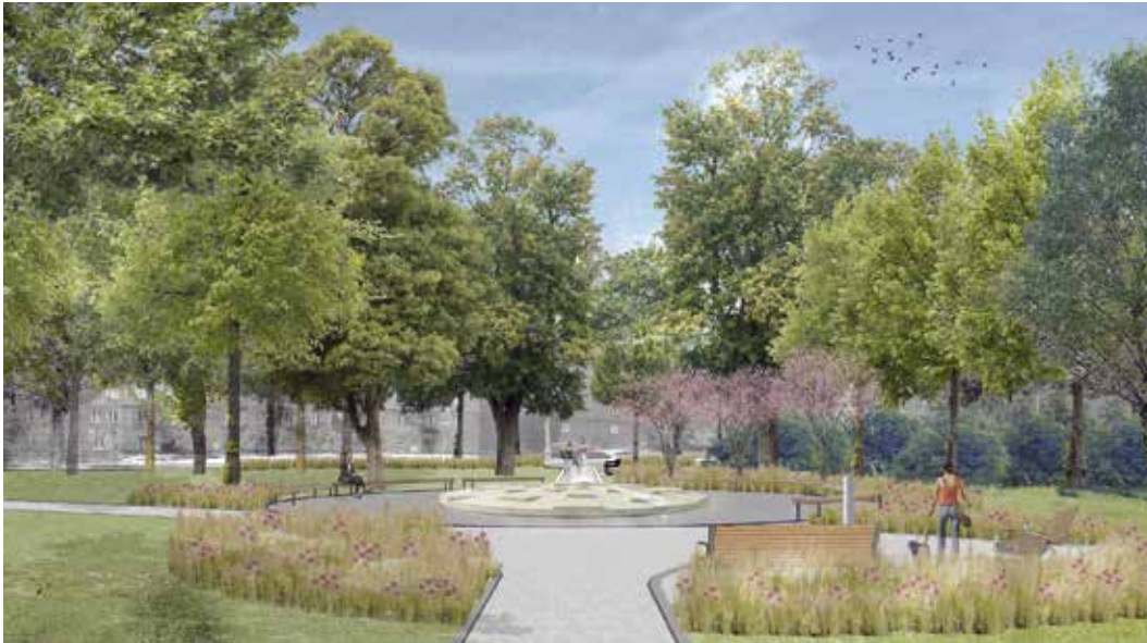
Také letos poputuje část rozpočtu Poruby na investiční akce – např. na dokončení rekonstrukce parku u DK Poklad, kterou završí instalace kašny Vladislava Gajdy. Vizualizace: ZAKA22

Letošní rozpočet Poruby zůstává i přes všechny nesnáze proinvestiční, když obvod plánuje do investic směřovat téměř sto milionů korun. Je to o něco méně než loni, ale to finišovala největší akce posledních let, rekonstrukce Oblouku.