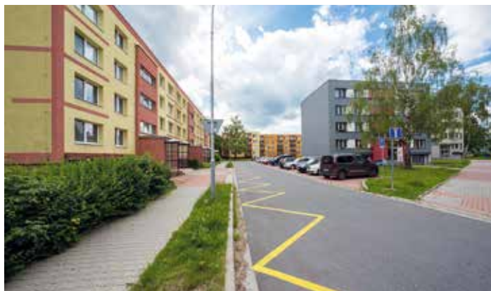
Ulice Otakara Jeremiáše

Zdroje: zivotopis.osobnosti.cz , www.ceskatelevize.cz , operaplus.cz , mapy.cz