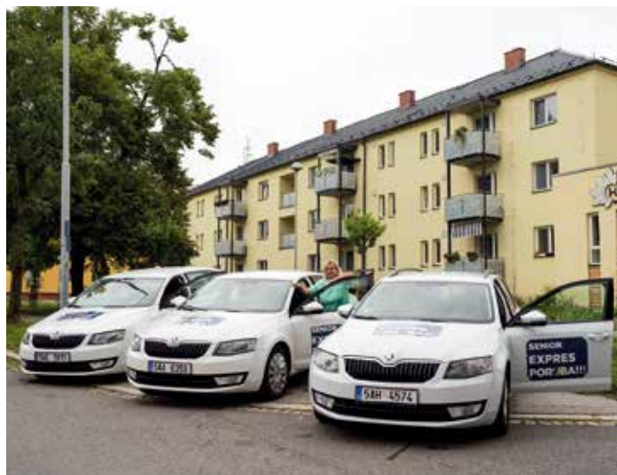
Senior expres využívají nejen Porubané, ale i obyvatelé okolních obvodů.

„Služba je mezi seniory oblíbená a počet lidí, kteří si vyřídili průkazku, měsíc od měsíce roste. Od uživatelů máme veskrze pozitivní reakce a be-