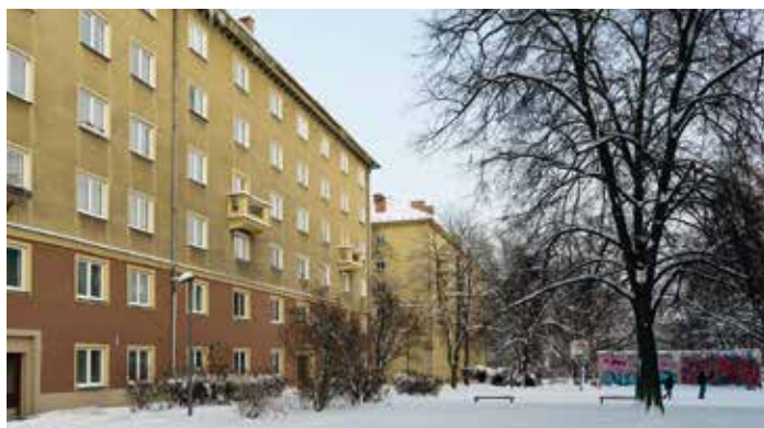
Ulice Jindřicha Plachty

Už během studií vystupoval v plzeňském divadle