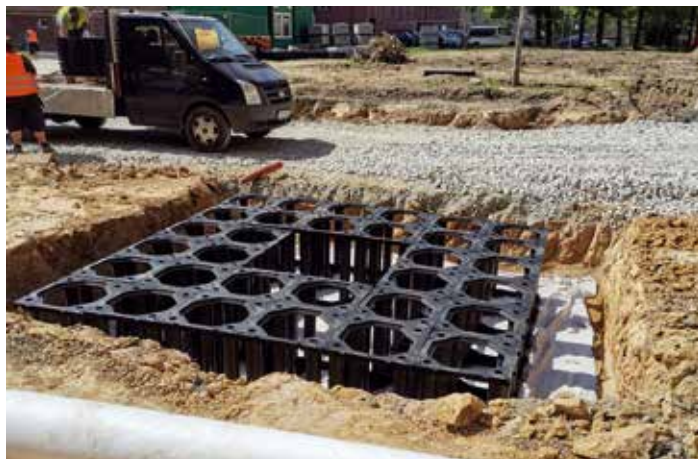
Systém prokořenitelných buněk využila Poruba například ve dvoře u náměstí Jana Nerudy a u nově vysazených stromů na náměstí Družby.

Technologie prokořenitelných buněk se zatím využila jen na několika místech v Česku. „Pro nás je to další zajímavý způsob, jak se moderním a efektivním způsobem starat o zeleň. Tuto metodu chceme využívat na vhodných místech. Zatím ji lidé najdou vedle náměstí Družby třeba i v opraveném vnitrobloku na náměstí Jana Nerudy,“ řekla starostka Lucie Baránková Vilamová. (mot)