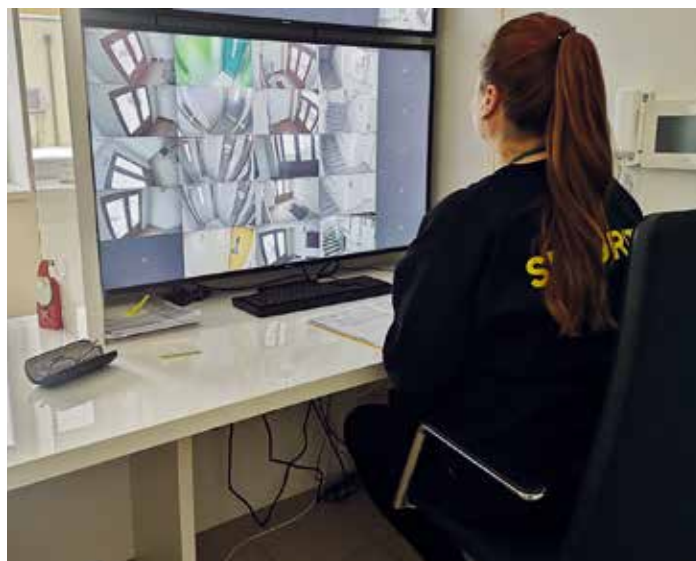
V dohledových centrech dohlížejí na bezpečnost a pořádek.

Výstupy z kamer monitorovalo dohledové centrum, které sídlí ve výškovém domě na Havlíčkově náměstí. Od listopadu přibyl druhé, které je v Domě s pečovatelskou službou Harmonie. „Centrum na Havlíčkově náměstí funguje už řadu let. Ale vzhledem k tomu, že těch kamer je tolik a nebylo v silách jednoho člověka je všechny ohlídat, vytvořili jsme druhé, které sídlí v Harmonii. S tím, že obsluha v domě na Havlíčkově náměstí nyní zároveň objekt pravidelně obchází a fyzicky kontroluje, zda je všechno v pořádku. Nové dohledové místo v Harmonii zároveň slouží jako recepce, takže ho dokážeme obsluhovat ve stá-