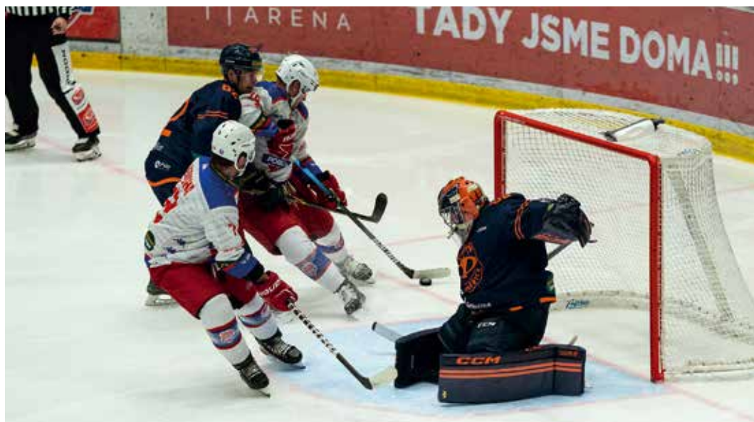
Kořením hokeje jsou branky. Poruba jich letos dává opravdu hodně.

V roce 1994 se klub vrátil k názvu HK Poruba a o rok později muži postoupili do II. ligy. První krize přišla na přelomu tisíciletí, kdy se mužstvo potýkalo s existenčními problémy. Přesto dokázalo soutěž vyhrát. Záchranu přinesla společnost Sareza. V sezoně 2003/2004 Poruba suverénně proplula II. ligou a historicky poprvé postoupila do druhé nejvyšší soutěže. Na tomto postupu měli zásluhu hráči jako Luka, Piecha, Dres-