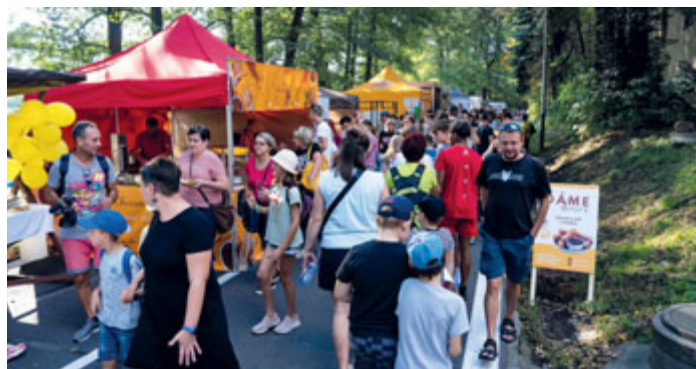
Nádherné počasí přilákalo do parku stovky lidí. Čekala na ně skvělá zábava, vynikající jídlo a mnoho dalších lákadel.