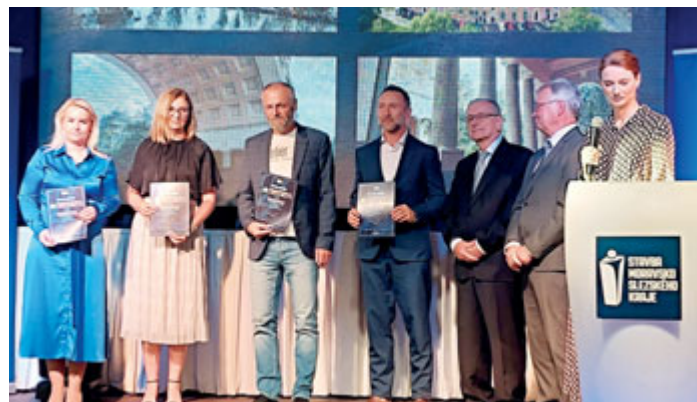
Oblouk získal čestné uznání v soutěži Stavba MSK.

Soutěž Stavba MSK se konala už posedmnácté. (mot)