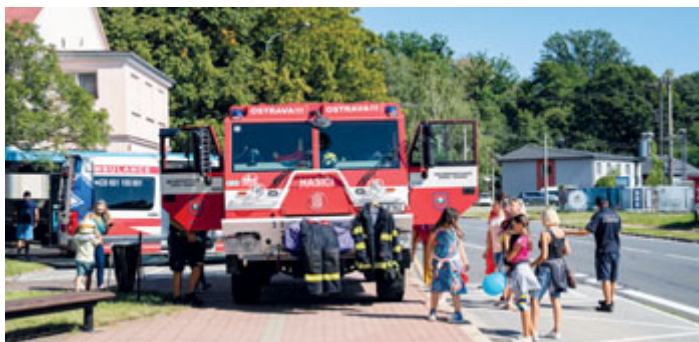
Technika dobrovolných hasičů z Pustkovce byla stejně jako například přítomná sanitka v neustálém obležení.