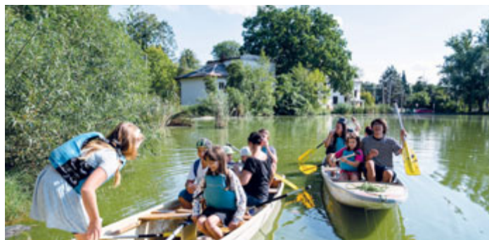
Svězt se na rybníku na lodičkách. Věc, která se vám může podařit jen jednou ročně. A to právě na akci Zažít Porubu jinak.