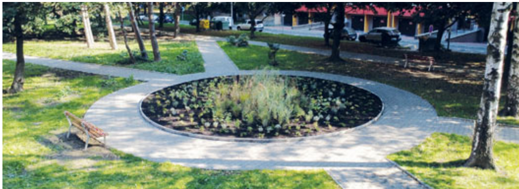
Revitalizované Nálepkovo náměstí