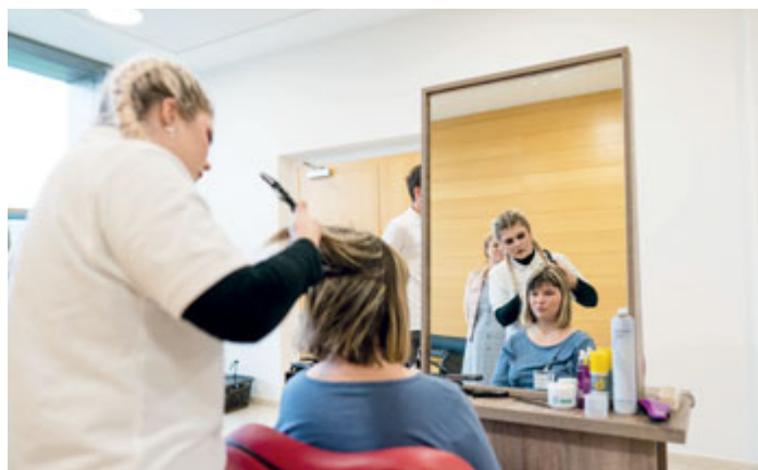
V porubských středních školách, se kterými se lze seznámit na přehlídce, se vyučuje řada atraktivních oborů.

Partnerem projektu je Vysoká škola báňská – Technická univerzita Ostrava .