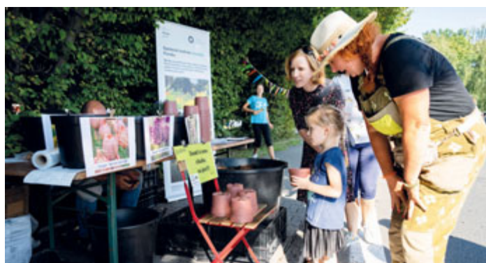
Tvůrčí dílna, ve které si děti mohly něco hezkého zasadit a odnést si to domů, se uskutečnila s podporou Norských fondů.