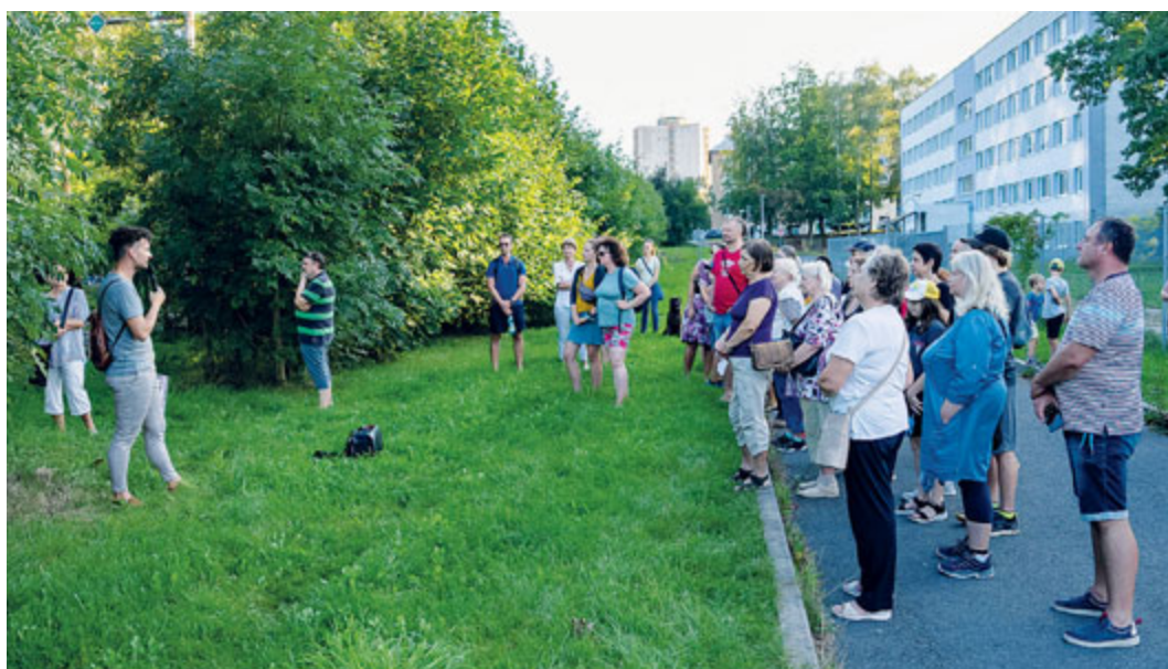
Procházka porubským čtvrtým obvodem