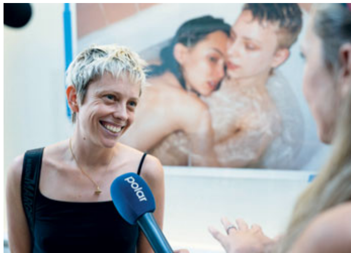
Autorka se zúčastnila vernisáže výstavy.

Kromě fotografie se věnuje také videu, instalaci a performanci. Proslavila se sérií svých autoportrétů a fotografickým cyklem Young American zachycujícím zástupce mladé americké generace. Je činná také jako kurátorka – první