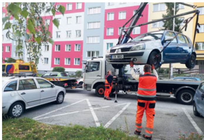
Odtahová služba pravidelně čistí ulice Poruby od nepojízdných aut.

Poruba nechává odtáhnout nejenom evidentní vraky, ale i takzvané nepojízdné automobily. Tedy vozy, které mají minimálně půl roku propadlou