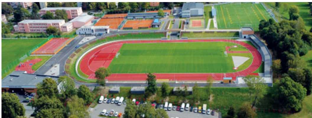
Sportovní areál Poruba je po rekonstrukci jedním z nejmodernějších sportovišť ve městě.