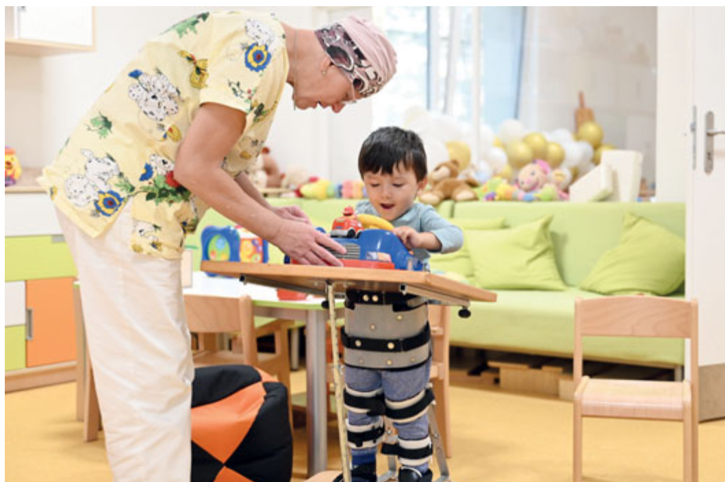
Dětem ve stacionáři na Ukrajinské ulici se denně věnuje tým odborníků.

Specifické jsou i další aktivity. Patří mezi ně pobyty v solné jeskyni, canisterapie, mu-