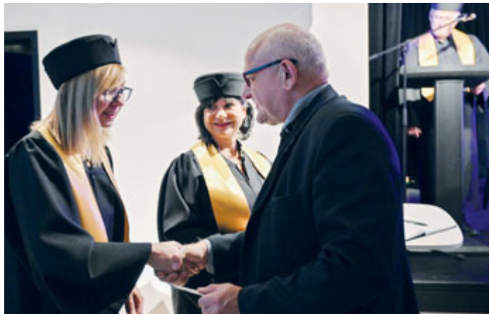
Slavnostní inaugurace se v DK Poklad konala 19. října.