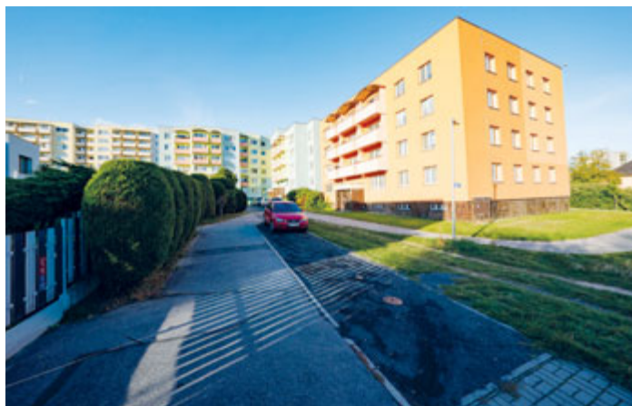
Ulice Plk. Rajmunda Prchalého

Plukovník Rajmund Prchala se narodil v roce 1917 v Pust-