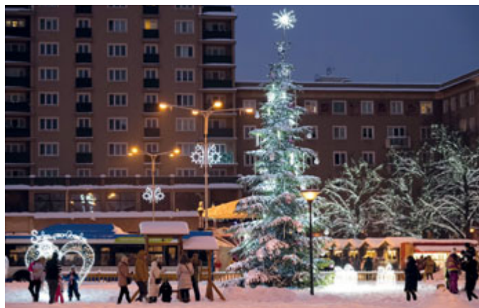
Vánoční strom se letos rozsvítí 3. prosince.

Ježíškova pošta Ve dnech 5., 7., 10., 12., 14., 17. a 20. prosince bude ve středovém pásu Hlavní třídy razítkovat dopisy pro Ježíška pošťák Štěpán. Připraveny budou workshopy, zimní kino pro děti, dřevěná dílna, vystoupení dětí z porubských mateřských a základních škol i regionálních kapel. K vidění bude také dře-