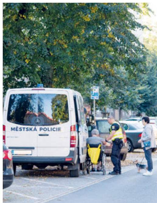
Velkou evakuaci kvůli nálezů nevybuchlé munice zažila Poruba v září roku 2021. Z domovů musely dočasně odejít tisíce lidí.