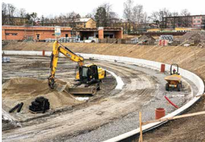
Rekonstrukce Sportovního areálu Poruba se chýlí ke konci.

Moderní areál rozšíří možnosti sportování pro Porubany i celou řadu klubů, které působí na území obvodu. Využívat ho chtějí fotbalisté Po-