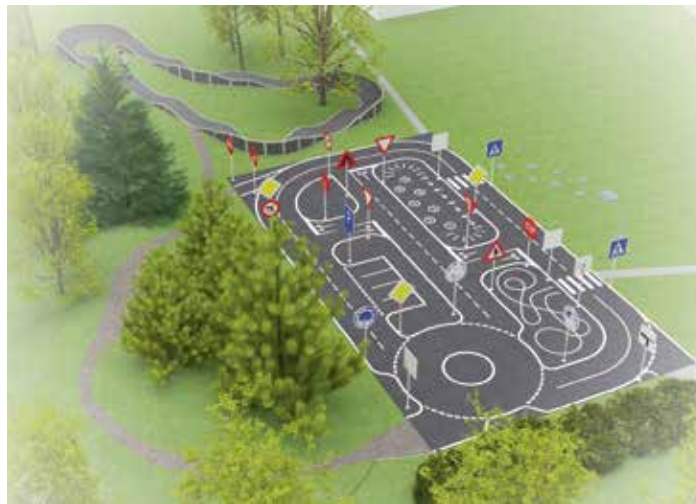
Vizualizace: Ondřej Turoň

Vítězný návrh získá až čtyři miliony korun a vznikne na místě nevyužívaného asfaltového hřiště poblíž křižovatky ulic Martinovská a Průběžná. Práce na proměně lokality začnou brzy. „Do konce června bychom chtěli mít hotový projekt. V červenci by se mělo začít pracovat, abychom byli do konce roku hotovi. Věřím, že nový dvůr bude inspirací pro ostatní a že se nám v dalším ročníku sejde více návrhů. Ukazuje se, že když má komunita zájem něco změnit,