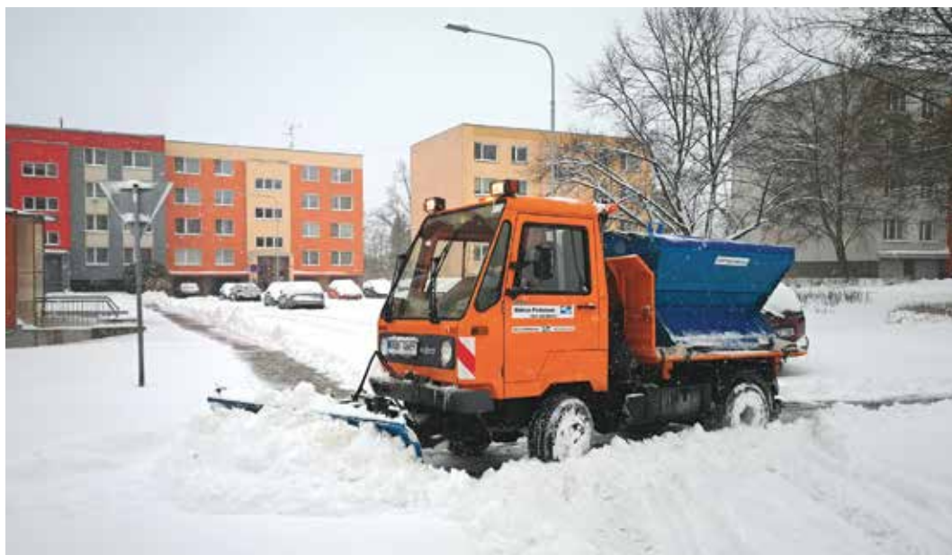
Zimní údržba je finančně velmi náročná.

Mohla by mít Poruba během zimy v pohotovosti více strojů? Mohla, ale... „Firma má pro nás vyhrazeny dva stroje na odklizení chodníků pro každý obvod a dva pluhy, které uklízejí cesty. Jen pro zajíma-