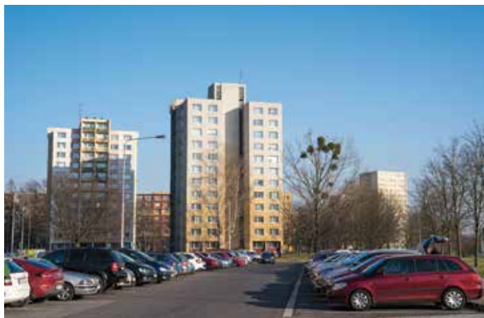
Náměstí Václava Vacka

Zdroje: www.ceskyhudebnislovník.cz , prazskypantheon.cz , www.ceskenoviny.cz , mapy.cz