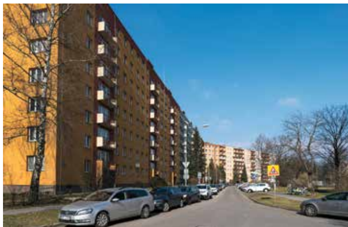
Ulice Jana Šoupala