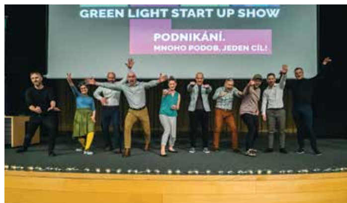
Green Light Startup Show podporuje startupy a podnikání v Moravskoslezském kraji už deset let.

Částka, kterou byly projekty podpořeny soukromými investory, přesahuje 62 milionů korun. (bur)