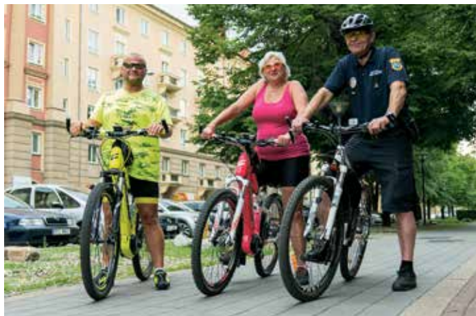
Na jaře se městská i státní policie zaměří na preventivní akce pro cyklisty a koloběžkáře.

Celá akce začne na Hlavní třídě v Porubě. „Tam se vrátíme pravidelně. Je to místo, kde cyklisté a chodci sdí-