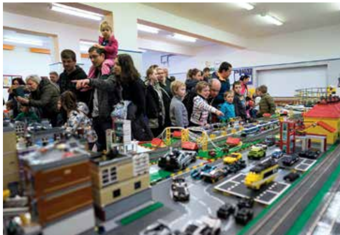
Svět fantazie z kostek se v Porubě uskuteční už popáté.

Děti jistě potěší zvířátka ze zoologické nebo Krakonošovy zahrady či papoušci v životní velikosti. Z Lego Duplo kostek bude mít na výstavě premiéru například model aquaparku vystavovatele z Ostravy.