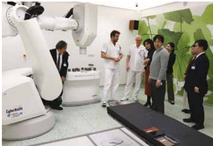
Fakultní nemocnici navštívili lékaři z Japonska.