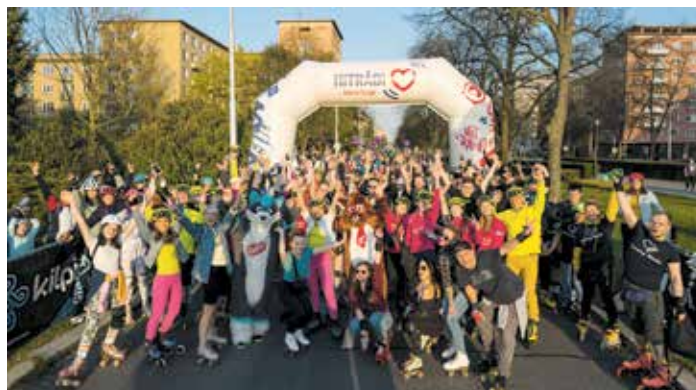
Sportovní akce na Hlavní třídě zahájí Ostrava na kolečkách.

„Vybrat si můžou ze dvou tras pro dospělé a další tři jsou připravené pro děti, žáky a studenty. Jejich délky jsou