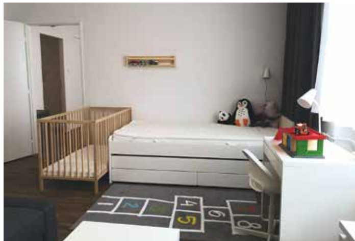
Krizové byty jsou zcela vybavené.

Krizové byty jsou poskytované i s vybavením. To v případě tohoto projektu dodala