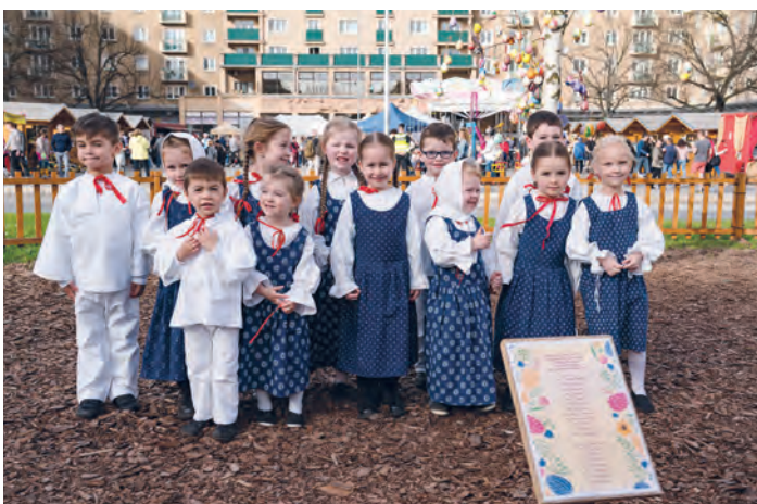
Velikonoční jarmark, který hostilo Alšovo náměstí od 25. do 30. března, zakončil bohatý kulturní program, včetně řady hudebních vystoupení. Nechyběl například dětský folklorní soubor Holúbek, velký ohlas měla charitativní sbírka Srdce pro Porubu. Svou práci představili také preventisté z Policie České republiky

Norway grants STÁTNÍ FOND ŽIVOTNÍHO PROSTŘEDÍ ČESKÉ REPUBLIKY Společně pro zelenější Evropu