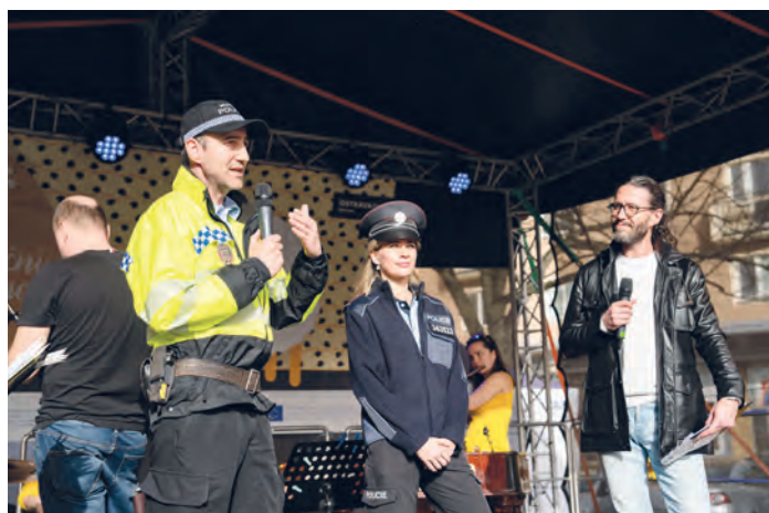
a z městské policie, kteří se věnují například besedám v základních a mateřských školách, pořádají příměstské tábory, kurzy sebeobrany atd.