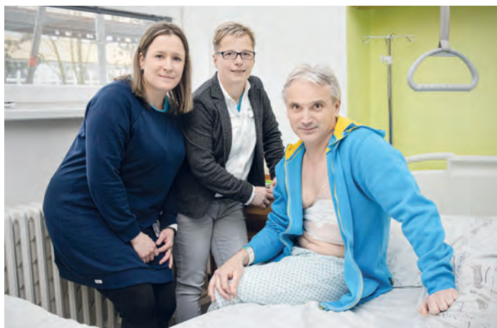
Dobrovolníci jsou žádáni. Pacientům dodávají hlavně psychické síly.

Zájemci o dobrovolnické aktivity ve FNO mohou volat na telefonní čísla 597 372 194 a 704 682 531 nebo psát na e-mailovou adresu simona.honsova@fno.cz. (ski)