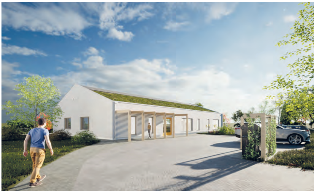
Odlehčovací služba by mohla být provozována v Centru sociálních služeb Poruba.