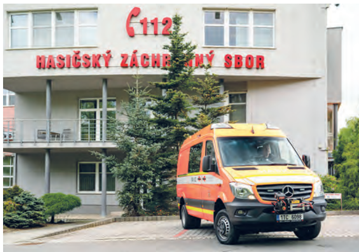
Mercedes-Benz Sprinter je speciální vozidlo, které využívá lezecké družstvo hasičů. Automobil je jediný v Moravskoslezském kraji.

V areálu hasičské stanice jsou také tři dráhy pro běh na 100 metrů s překážkami, 200metrový ovál, kde lze trénovat štafetu 4 x 100 metrů s překážkami a čtyři dráhy pro disciplínu požárního sportu výstup do čtvrtého podlaží cvičné věže. Areál rovněž využívají jednotky sborů dobrovolných hasičů pro nácvik jednotlivých disciplín požárního sportu. (ski)