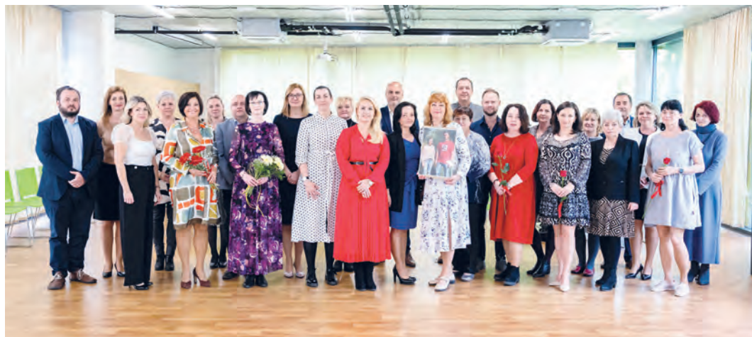
Porubští kantorů byli oceněni v Komunitním centru Všichni spolu.

Ve svátečně-pohodové atmosféře byli 17. dubna v Komunitním centru Všichni spolu ocenění pedagogové z porubských mateřských a základních škol.