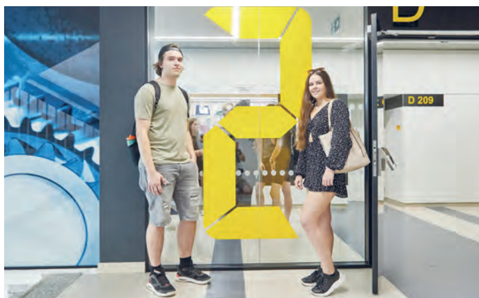
Stále je šance studovat. Na VŠB-TUO nyní probíhá druhé kolo přijímacího řízení.

Studenti a studentky mají k dispozici i studijní program Inteligentní doprava a logistika na Fakultě strojní nebo studijní program Revitalizace posthornické krajiny, který otevírá Hornicko-geologická fakulta. Do