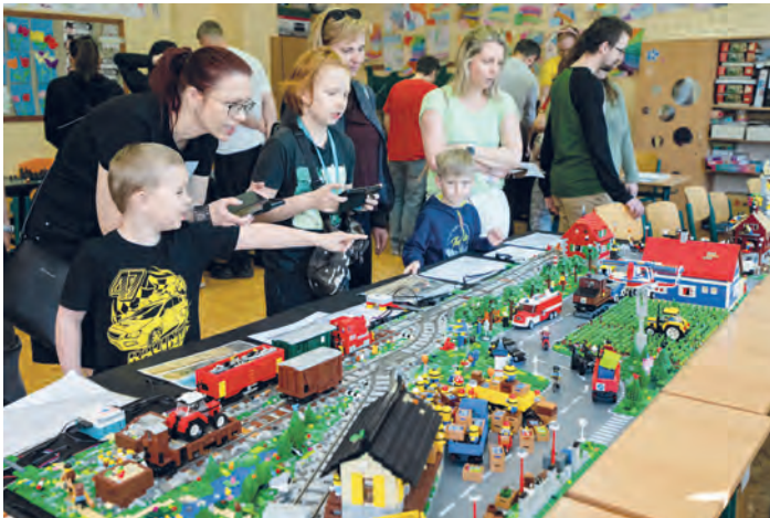
Na akci Svět fantazie z kostek představili své lego modely tvůrci z fóra kostky.org. Do Základní školy Dětská si 13. a 14. dubna našlo cestu přibližně 4 500 návštěvníků, kteří zhlédli například podmořský svět, pevnost Orků, porubský Oblouk, Gargamelův hrad atd.