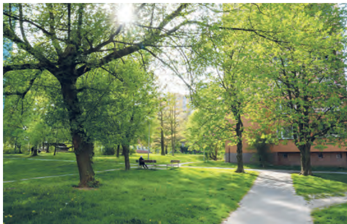
Zelené bohatství je doménou porubských dvorů.

Potvrzuje to například aktuální výsadba letničkových záhonů, které nahrazují dvouletkové záhony na Hlavní třídě, Havlíčkově náměstí, náměstí Antonie Bejdové, ulicích Gen. Sochora, Martinovská atd. „V souladu s arboristickými standardy probíhají také ořezy nově vysazených dřevin, u stávajících dřevin zajišťujeme průchozí a průjezdní profil a ořezy suchých větví. K tomu dochází