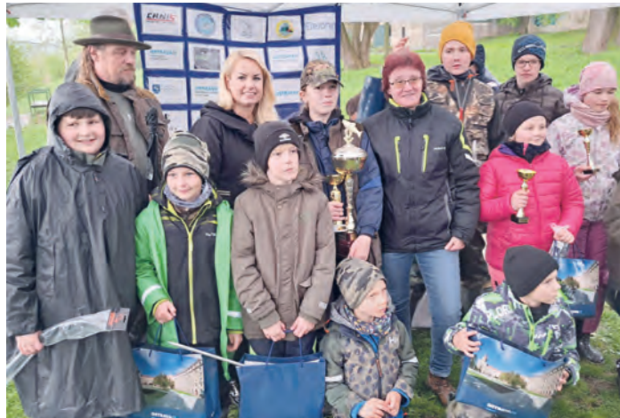
Rybářské závody dětí do 15 let nazvané O pohár starostky se uskutečnily 20. dubna v areálu Zámeckého rybníku. Všichni, kteří se zúčastnili, dokázali chytit aspoň jednu rybu. Nejúspěšnější si odnesli ceny, které věnoval městský obvod Poruba.