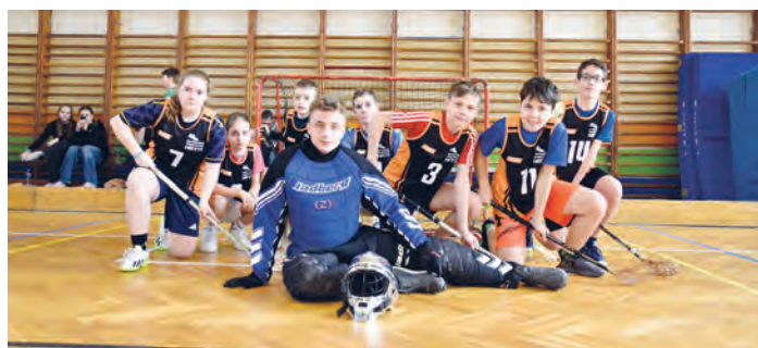
Do florbalového turnaje se zapojilo sedm smíšených družstev.