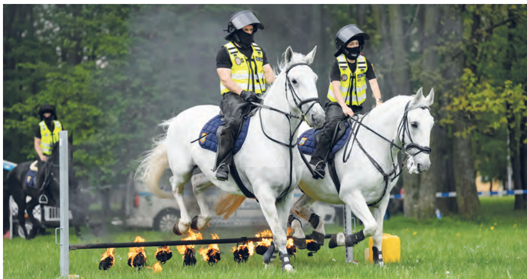
V loňském roce strážníci městské policie předvedli ukázkou výcviku koní.

Strážníci městské policie nechají pomyslně nahlédnout do kuchyně kynologů a hipologů a odprezentují jejich know-