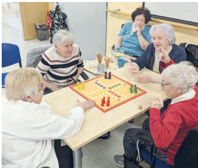
Turnaj seniorů v deskové hře Člověče, nezlob se! se konal ve druhé polovině března.

Seniori, kteří se setkávají v bytovém domě U Oblouku, rádi hrají karty. Zároveň mají mezi sebou členky, které vynikají v ručních pracích. Scházejí se ve všedních dnech v odpoledních hodinách.