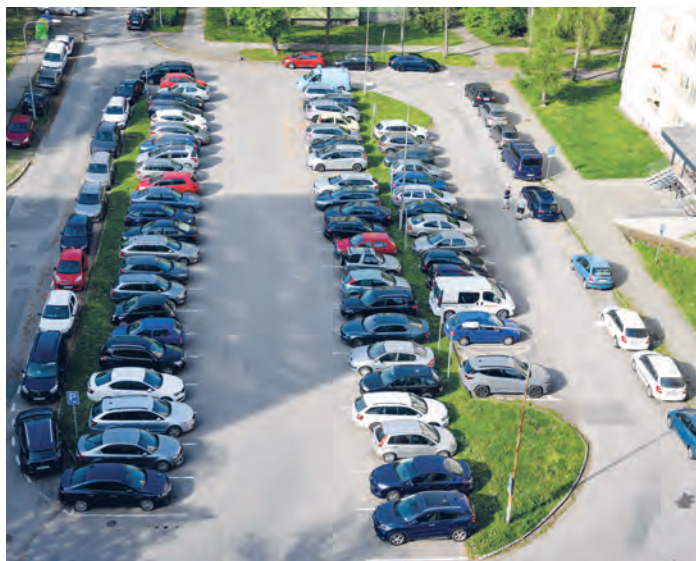
Velmi častá situace. Parkoviště u domů jsou zcela obsazena.