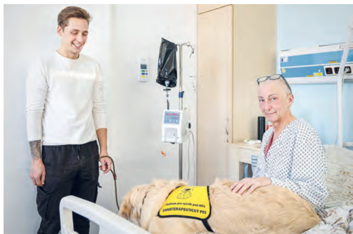
Canisterapie je součástí léčby na více oddělení FNO.