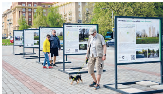
Ve středovém pásu Hlavní třídy u kruhového objezdu byla do 7. května k vidění výstava, která mapovala proměnu čtrnácti nevyužívaných asfaltových ploch v ostrovy plné stromů a zeleně. Stalo se tak díky financím z Norských fondů. Celkem bylo vysazeno více než sto stromů, na ulici Průběžná i přes tisíc levandulí.

Norway grants STÁTNÍ FOND ŽIVOTNÍHO PROSTŘEDÍ ČESKÉ REPUBLIKY Společně pro zelenější Evropu