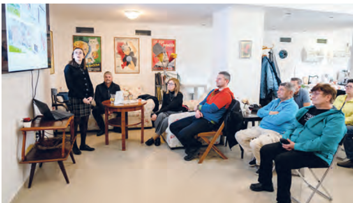
V galerii Staré časy se 18. dubna konalo veřejné setkání zástupců radnice s občany. S ohledem na plánovanou revitalizaci dvoru mezi Hlavní třídou a ulicí Jindřicha Plachty byla představena analýza tohoto prostoru. Příchozí se mohli vyjádřit, které prvky by ve vymezeném území chtěli zachovat a které nahradit. Návrhy budou podkladem pro připravovanou studii. Často zmiňovanými tématy byly zlepšení možnosti parkování a řešení možností pro hru či sport dětí.