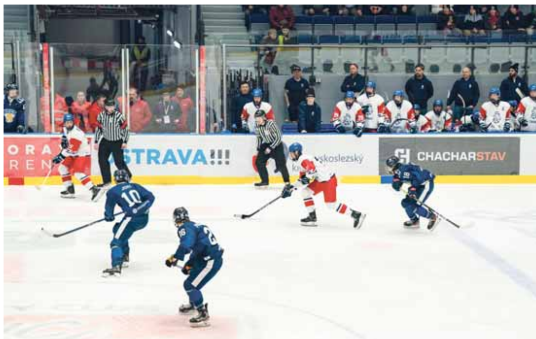
Česká hokejová sedmnáctka odehrála v Porubě tři zápasy. Mimo jiné se utkala s Finskem.