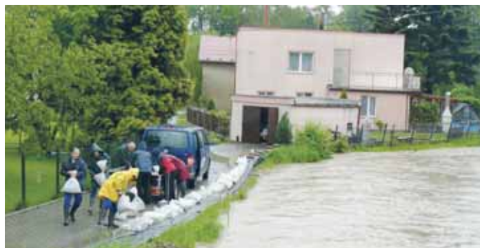
Rozvodněná Porubka v roce 2008

Během posledních patnácti let byl na území Moravskoslezského kraje vyhlášen z důvodu povodní dvakrát stav nebezpečí (2009, 2010) a třikrát nouzový stav. V letech 2020 a 2021 byl příčinou koronavirus, v roce 2022 jej způsobila migrační vlna z Ukrajiny. (mmr)