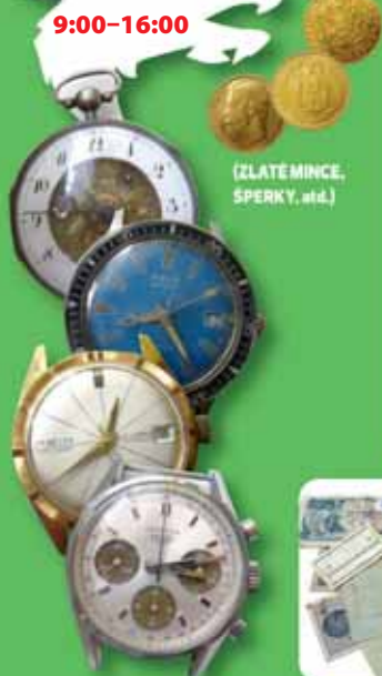
(ZLATÉ MINCE, SPERKY, atd.)

Výkup se bude konat ÚTERÝ 12. 3. STŘEDA 13. 3. 9:00–16:00