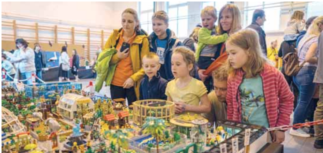
Svět fantazie z kostek nemá hranice. Nadšení jsou děti i dospělí.

Už pošesté se uskuteční Svět fantazie z kostek. Interaktivní výstava, na které svá díla představí tvůrci lego modelů, zavítá do Základní školy Dětská 13. a 14. dubna.