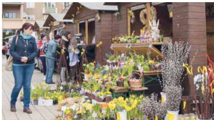
Na jarmarku bude možné zakoupit bohatý velikonoční sortiment.

Příchozí se mohou těšit na tři různorodé hudební interprety. Od 15.15 hodin se představí