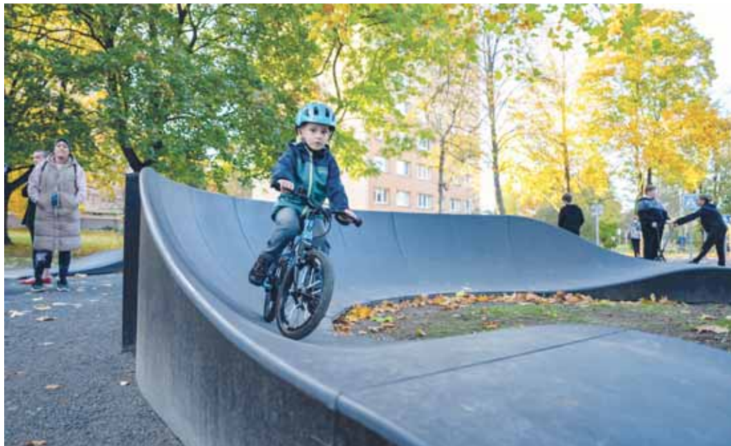
Na pumptracku se vyřádí děti různého věku.

Startuje sedmý ročník participativního rozpočtu. Do 31. března mohou Porubané starší 15 let podávat návrhy, které zatraktivní veřejný prostor v obvodě.