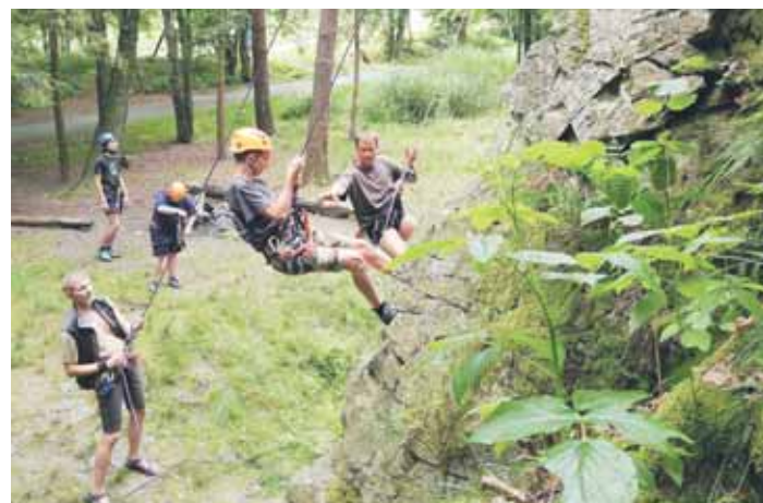
Žáci ze ZŠ a MŠ Ukrajinská 19 rádi sportují. Snaží se dělat to co jejich zdraví vrstevníci.