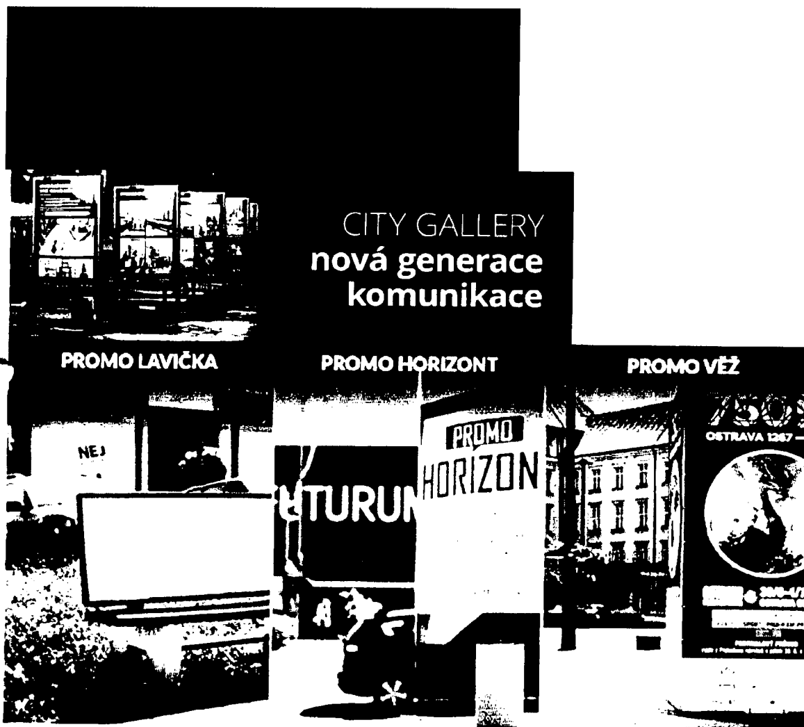
plátek 300 ks v Ostravě na parkovišti 1000 Kč